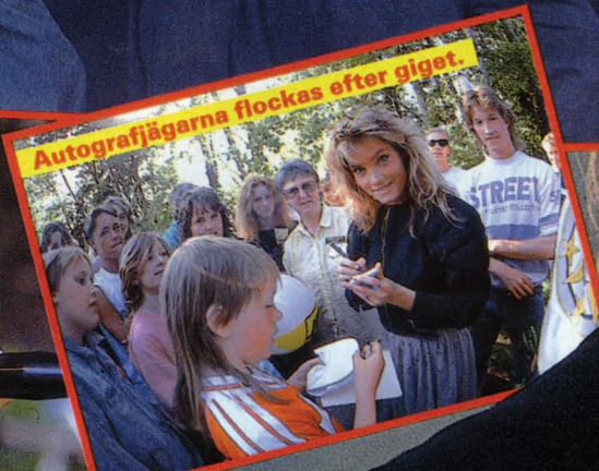
Autografjägarna flockas efter gigot.