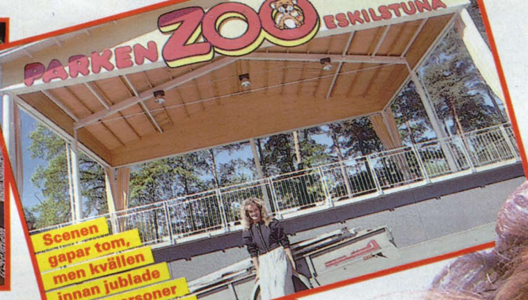
Scenen gäpar tom, men kvällen innan jublade 2 000 personer åt hennes show.